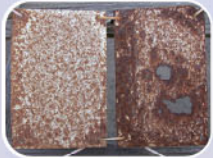
วัสดุหลังคาเหล็กทั่วไป