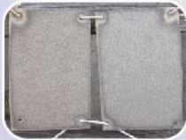
จิงใจเหล็ก® เทคโนโลยีออสเตอเรล ทนทาน ไม่เป็นสนิมยาวนานกว่า

แกร่งกว่าซัวร์ ชั้นเคลือบหนากว่า ด้วยเทคโนโลยีออสเตอเรล ทนทานกว่าซัวร์ ทนทาน ไม่เป็นสนิมยาวนานกว่า